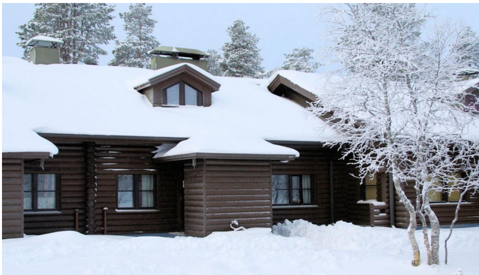
Kiilopään huoneisto